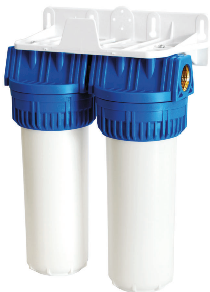
Contenitore per cartucce serie FP3 Duplex testa inserto ottone vaso opaco bianco FP3 Duplex filter cartridge housings with brass inserts and opaque white sump