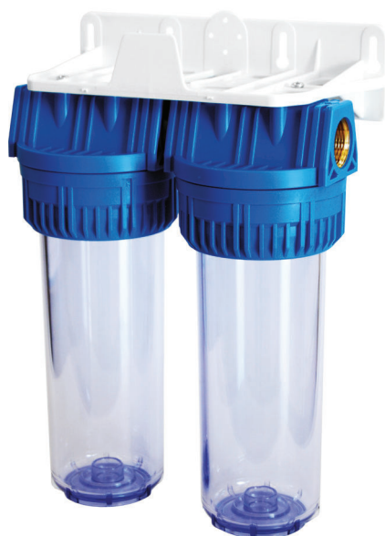
Contenitore per cartucce serie FP3 Duplex testa inserto ottone vaso SAN trasparente FP3 Duplex filter cartridge housing with brass inserts and transparent SAN sump